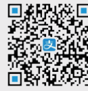
Alipay HK 支付寶HK