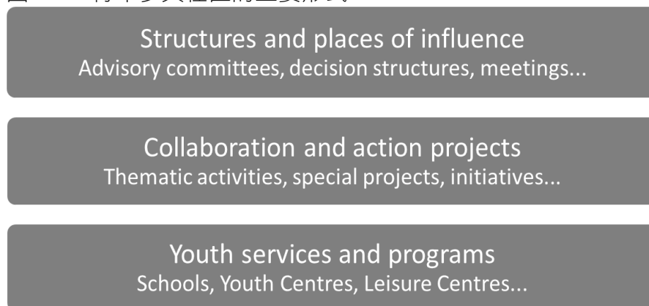
圖 3.1：青年參與社區的主要形式